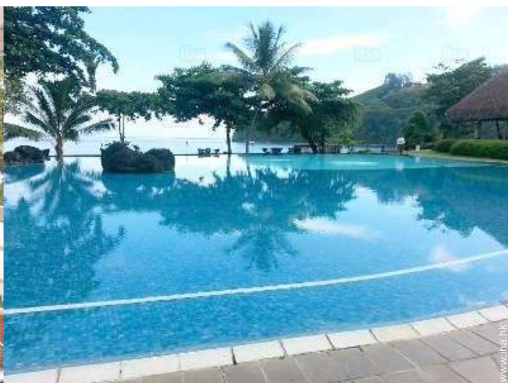
(带水循环处理) 游泳池