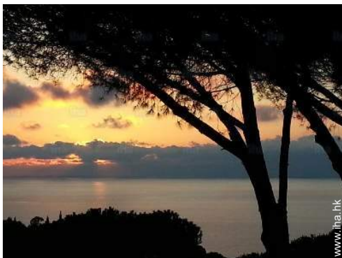
从附属物处看到的景象